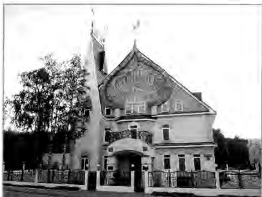
Илл. 2. Дом-музей народного художника СССР В. А. Игошева

шева» и «Дом-музей народного художника СССР В.А. Игошева» — работает чуть больше 70 человек.