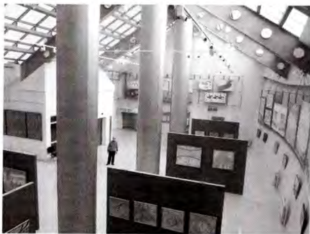
Илл. 6. Стационарная экспозиция в Галерее-мастерской художника Г.С. Райшева. «Пространство – Время»

Стационарная экспозиция «Югорский край глазами сердца» в Доме-музее народного художника СССР В.А. Игошева представляет более 100 живописных произведений его «северного цикла». Искусство Владимира Александровича Игошева — заметная страница истории русской живописи второй половины XX века, повествующая о крупной творческой индивидуальности, о масштабности духовного мира художника. Творчество народного художника СССР Владимира Александровича Игошева нераз-