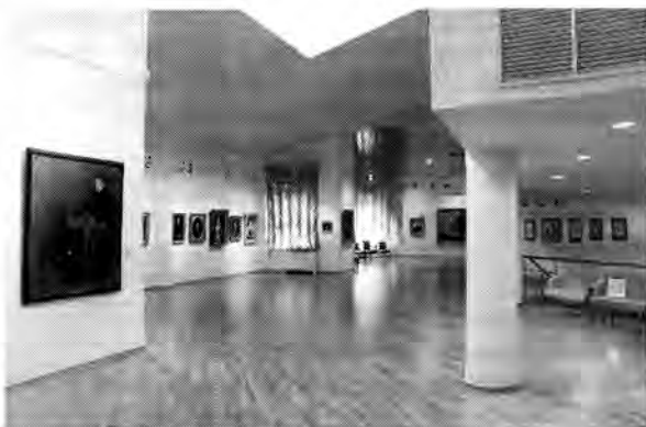
Илл. 5. Экспозиция «Женский образ через века». XVIII–XX века