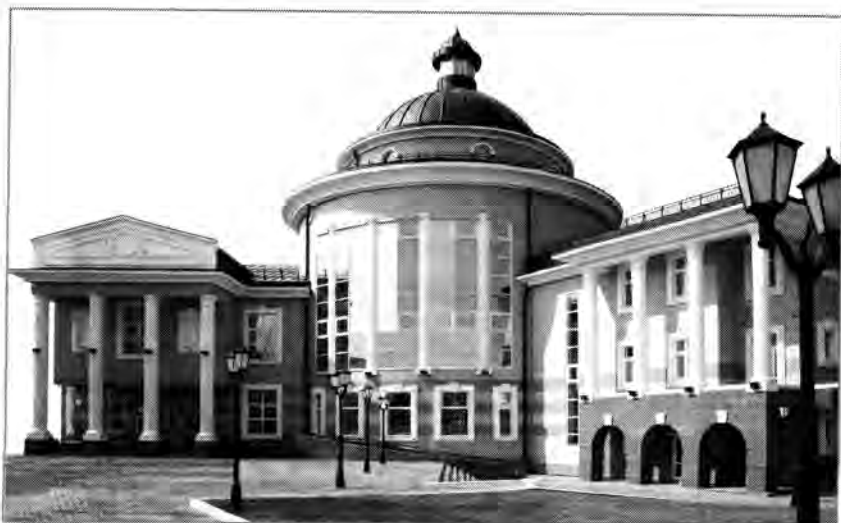
Илл. 1. Государственный художественный музей

ческая доминанта — мозаика «Моя Сибирь» (площадь почти 700 м 2 ) по эскизам художника Г.С. Райшева. При строительстве здания использованы материалы и архитектурные решения, характерные для стиля хайтек, например прозрачная стеклянная крыша-фонарь, которая подсвечивается по вечерам.