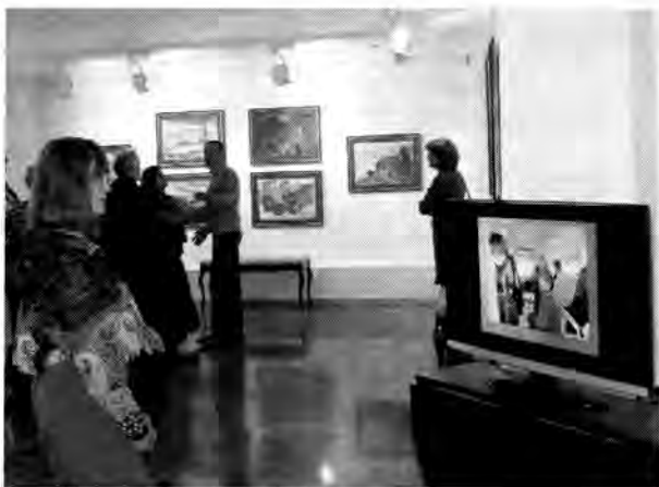
Илл. 10. Выставка по итогам пленера, 2011

ратура, которые когда-то использовались в съемочном процессе, а теперь стали музейными экспонатами. В одном из залов расположилась фотовыставка знаменитого актера Юозаса Будрайтиса, профессионально занимающегося фотографией с конца 1960-х годов. Его персональные выставки прошли в Москве, Вильнюсе, Калининграде, Нижнем Новгороде, Санкт-Петербурге, Мурманске.