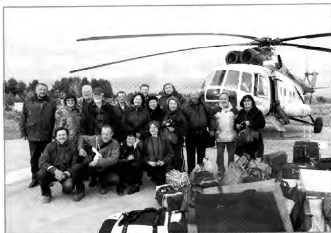
Илл. 9. Творческая команда Арт-пленера 2011 по прибытии в Березовский район