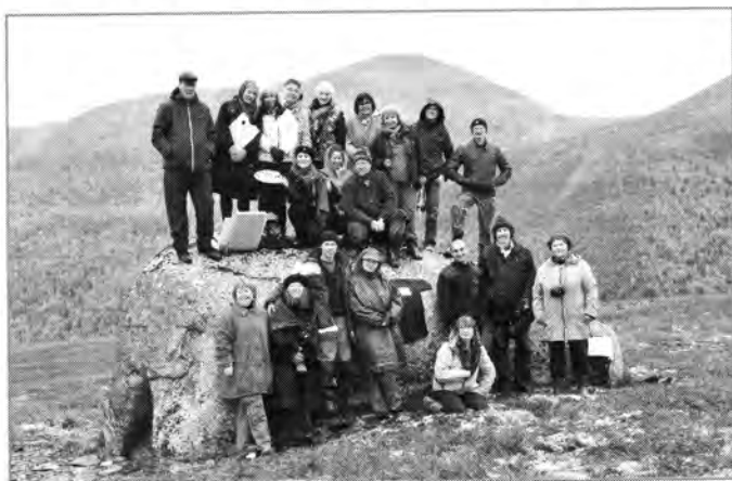
Илл. 8. Арт-плонер 2011. Приполярный Урал